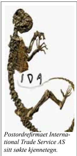
Postordrefirmaet International Trade Service AS sitt søkte kjennetegn.

Alle i Norge har hørt om fossilet "Ida" og striden som oppsto i forhold til de immaterielle rettighetene til fossilet. Saken illustrerer at offentlige instanser kan sitte på betydelige immaterielle verdier og at det er behov for å være seg bevisst disse, i forhold til å sikre og forvalte verdiene på en god måte. For en slunken kommunekasse kan det i immaterielle rettigheter ligge store uoppdagede verdier.